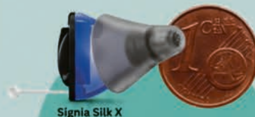
Signia Silk X