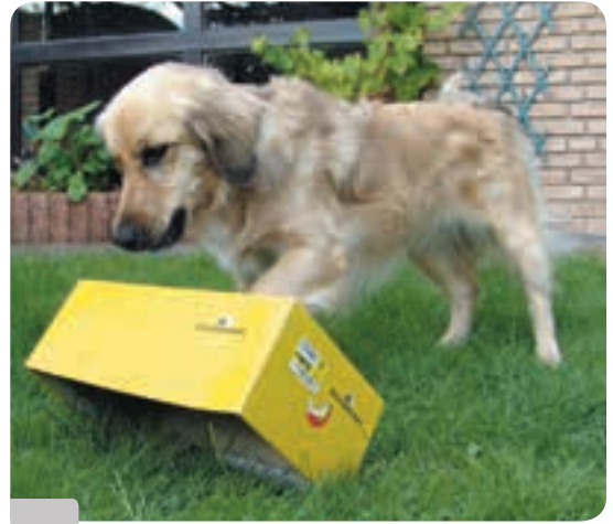
Ein Karton, ein Bröckchen Futter und jede Menge Spaß: Viele Beschäftigungsmöglichkeiten lassen sich genau so einfach umsetzen.

Hallo und herzlich willkommen im Spielbuch für den Hundealltag! Dass Sie hier sind zeigt: Es liegt Ihnen am Herzen, dass Ihr Hund glücklich, zufrieden und ausgeglichen ist. Sie wissen, ein gesundes Maß an Beschäftigung gehört einfach dazu! Hier finden Sie die Ideen dafür: einen