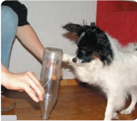
Langeweile war gestern: Hier können Sie was erleben!